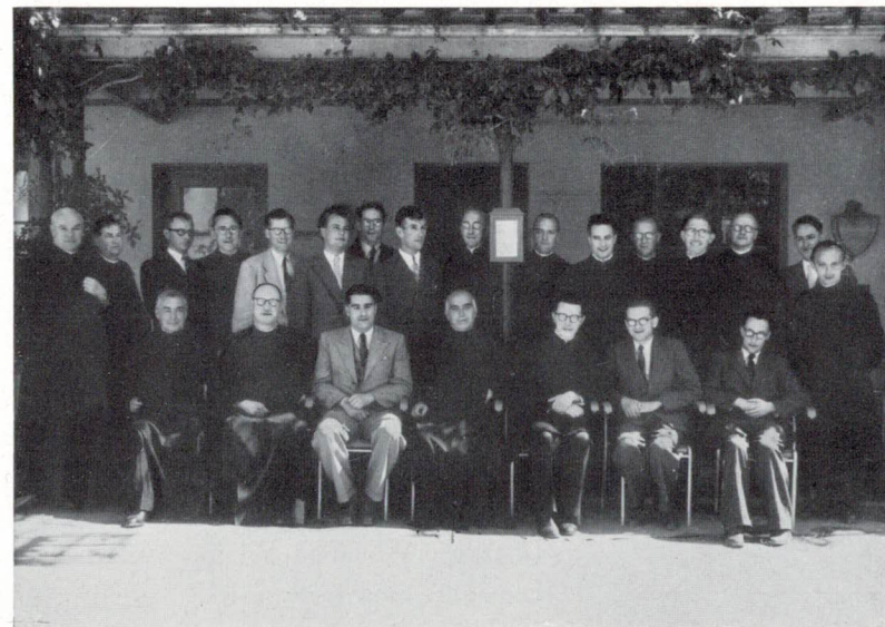
Maturi von 1939

Wir haben vor 10 Jahren nicht alles verstanden, was uns am Kollegi begegnet ist. Heute aber spürten wir es, wie sehr hinter allem die Liebe